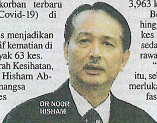
DR NOOR HISHAM

Reagen di Malaysia menggunakan kaedah Real-Time Reverse Transcription-Polymerase Chain Reaction (rRT-PCR).