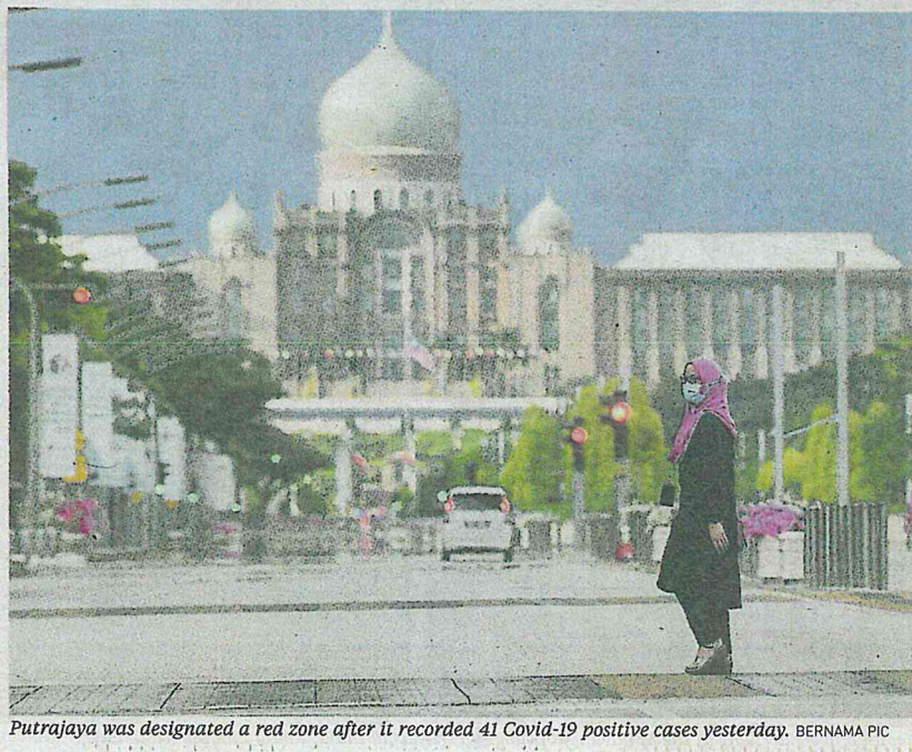
Putrajaya was designated a red zone after it recorded 41 Covid-19 positive cases yesterday.

Lembah Pantai remains the location with the highest number of Covid-19 patients with 386 cases, followed by Hulu Langat (324) and the Petaling district (296).