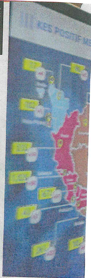
Health director-general Datuk Dr Noor Hisham Abdullah (centre) giving an update on the Covid-19 situation in Putrajaya yesterday.

"The current stock we have for reagents could only last us a week, but we have contacted the suppliers to urge them to increase their production."