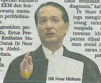
DR Noor Hisham

KKM sebelum ini memutuskan selain hospital, pusat kesihatan kerajaan serta hospital swasta juga dibenarkan menawarkan ujian saringan Covid-19 dengan bayaran dianggarkan lebih RM500 dan perlu ditanggung sendiri mereka yang mahu diuji.